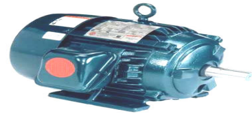
FIGURA No. 2